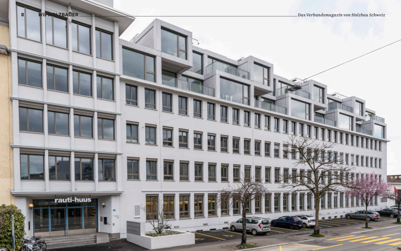
Das Rautihuus wurde 1948 als Bürogebäude einer Lüftungsfirma gebaut. Mit der anspruchsvollen Aufstockung in Holzbauweise sind 17 neue Mietwohnungen geschaffen worden.

In Zürich gibt es zahlreiche leerstehende Büroflächen, aber viel zu wenig Wohnraum. Vor diesem Hintergrund ist die Umnutzung von Immobilien ein kluger Schachzug. So etwa im Quartier Albisrieden: Das Rautihuus diente über Jahrzehnte als reiner Gewerbebau. Mit einer dreigeschossigen Aufstockung im Holzbau wurde nun der Wohnanteil von 0 auf 40 Prozent erhöht. Die 17 Mietwohnungen mit einer Bushaltestelle direkt vor der Haustür waren innerhalb einer Woche vergeben.