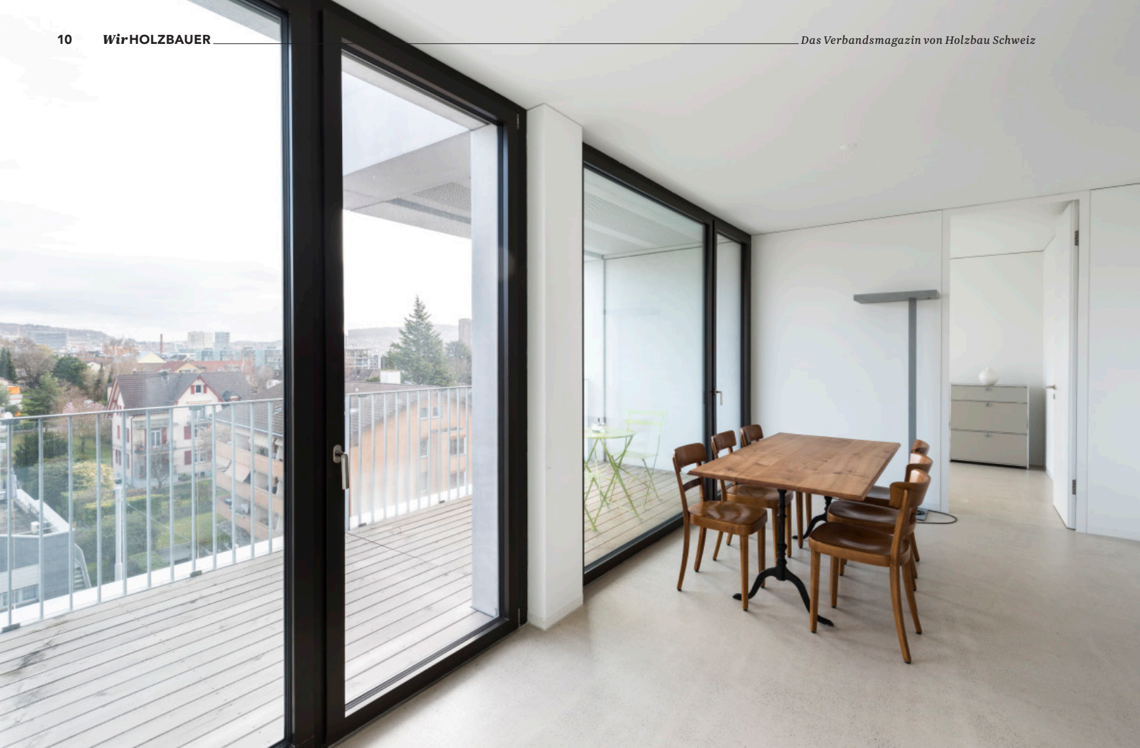
Grosszügige, helle Räume werden ergänzt von grossen Aussenflächen. Dank der verschachtelten Einheiten verfügt jede Wohnung über einen nicht einsehbaren Balkon.

erhalten, ebenso die Angaben für die notwendigen Verbindungen, die an vielen Orten auf die Träger aufgeschweisst werden mussten. Dank der guten Datengrundlage gab es auch hier keine Probleme. Ich habe die Pläne gezeichnet, und der Stahlbauer konnte sie direkt in die Produktion geben.