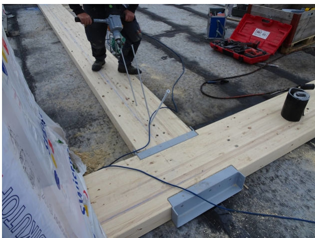
Renforcement par le haut