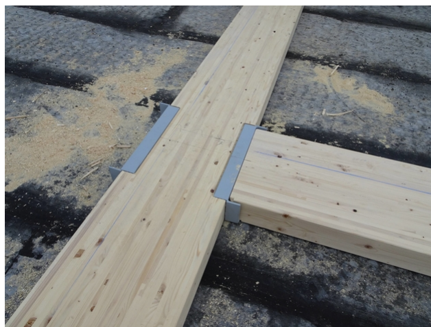
Croisement de poutres