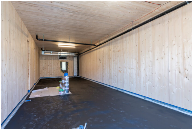
2ème étage