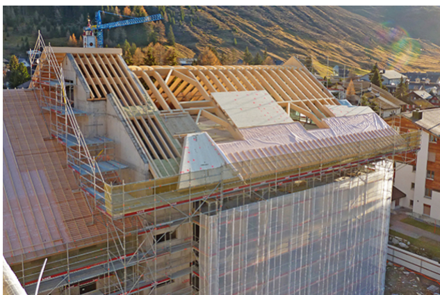
Montage de traverses et d'éléments de toiture Bâtiment H3