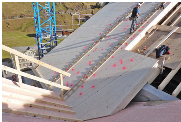
Montage d'éléments de toiture sur la structure primaire