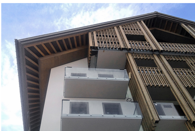
Vue détaillée de la verrière d'angle