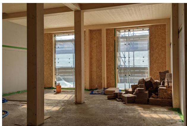
Derrière, le nouveau bâtiment en bois est en cours de construction.