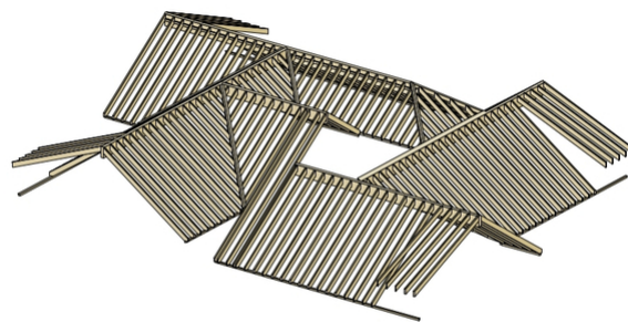
Vue MFH 3D