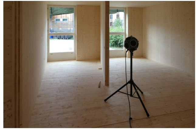
Schallmessung im Mockup