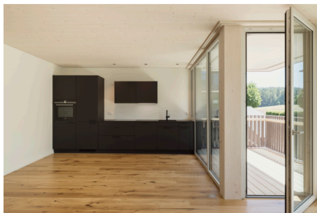
Construction TS3 à l'état fini