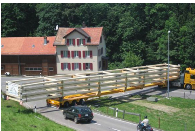
Détail avec la technologie GSA Transport Binder : c'est étroit dans le pays d'Appenzell