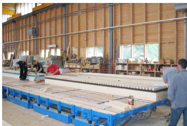
Fabrication d'éléments de toiture