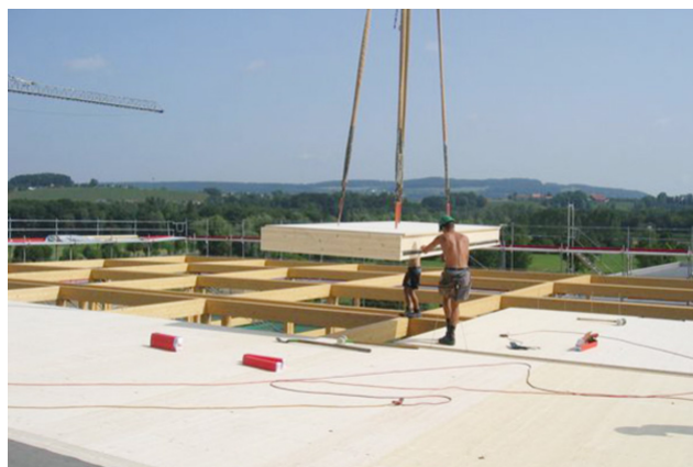
Montage d'éléments de toiture