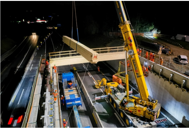
Les poutres pèsent environ huit tonnes