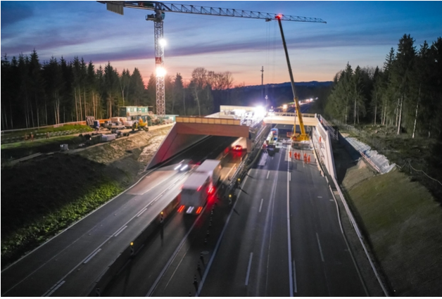
Travaux de montage avec circulation sur une seule voie