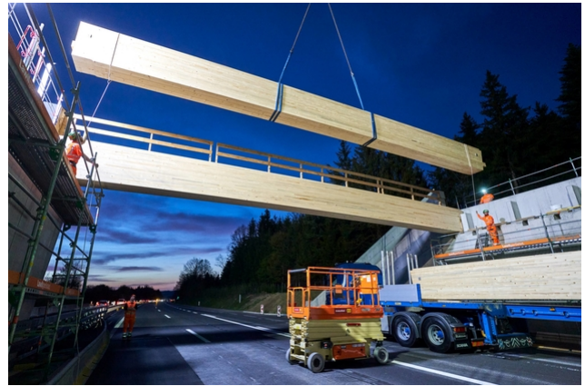
...et sont posés en une seule pièce sur les fondations en béton.