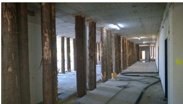
Soutien provisoire avec des troncs d'arbres