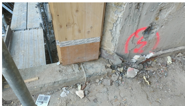
Raccordement de la structure en bois aux éléments en béton existants