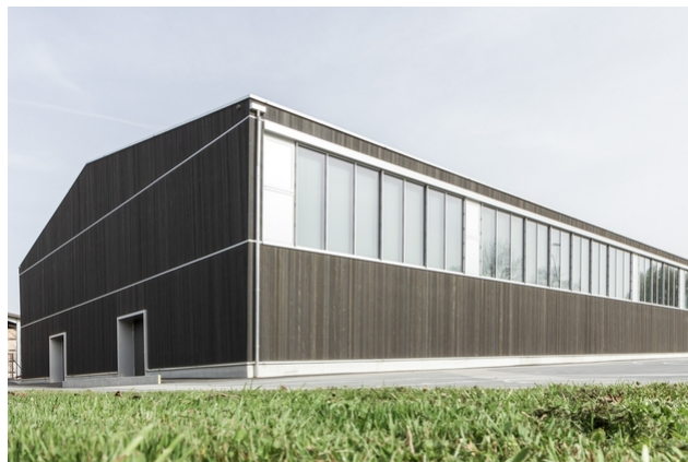
Gymnase après la rénovation