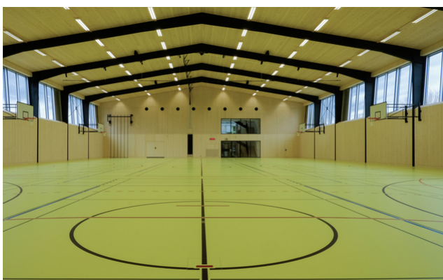
Vue intérieure après la rénovation