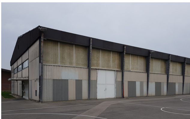
Gymnase avant la rénovation