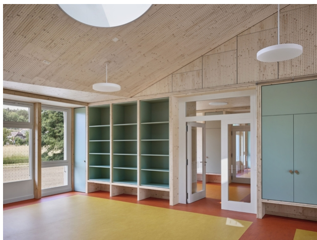
Concepts de couleurs et de matérialisation cohérents à l'intérieur