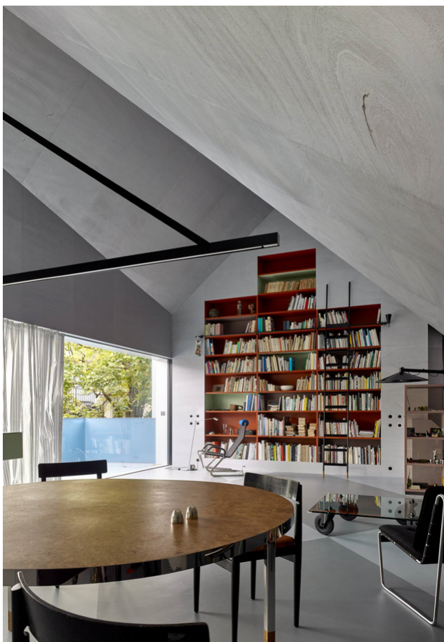
Salle de séjour