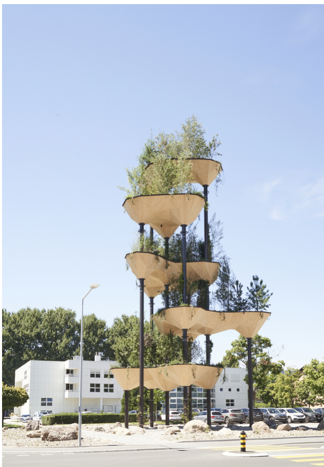
Semiramis au cœur du Tech Cluster