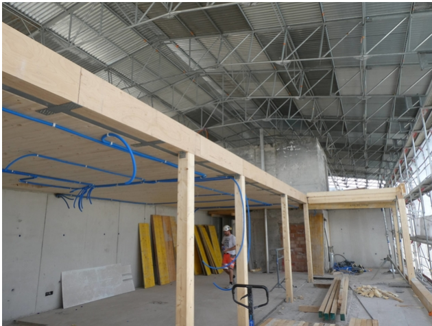
Aufstockung unter dem Notdach