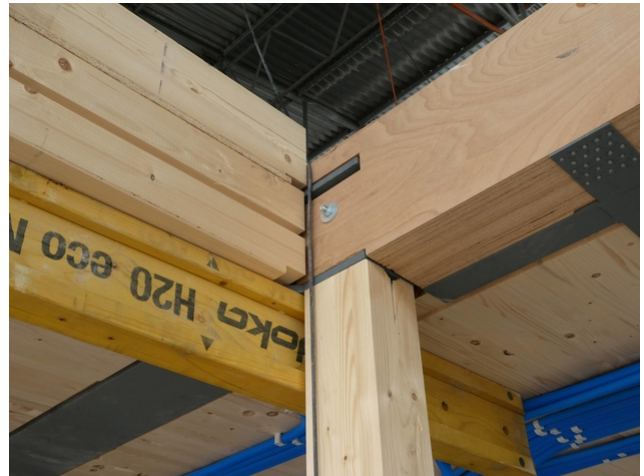
Träger aus Buchenholz