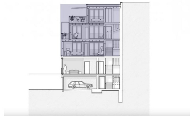
Querschnitt der Aufstockung