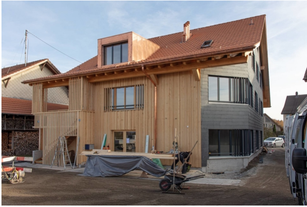
Brandschutzfassade zum Nachbarhaus