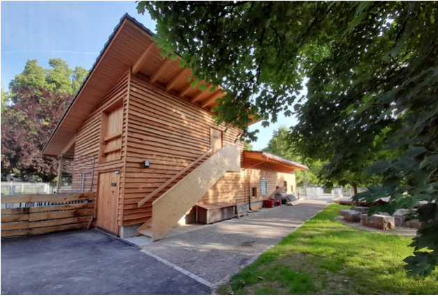
Gebäude mit Lärchenholzfassade