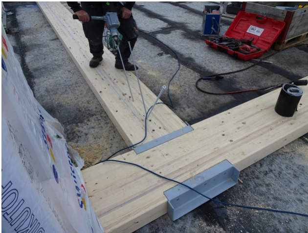
Verstärkung von oben