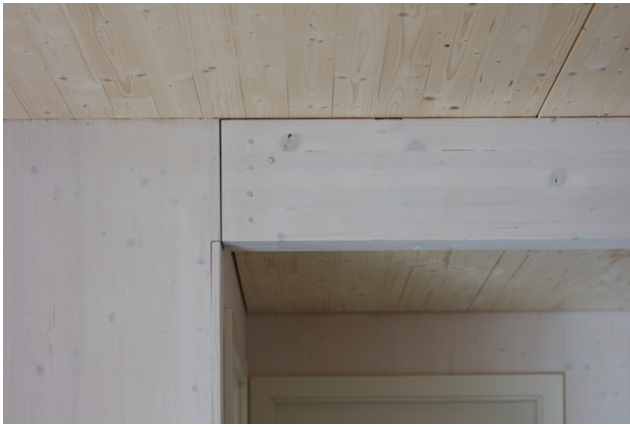
Unterzug mit eingepprägtem Stahlblech