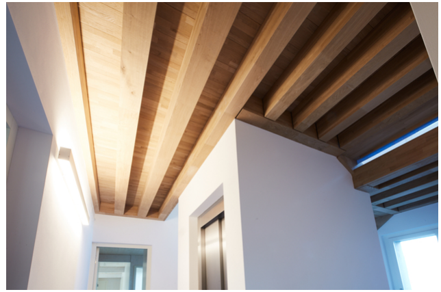
Treppenhaus und Liftschacht in Holzbauweise