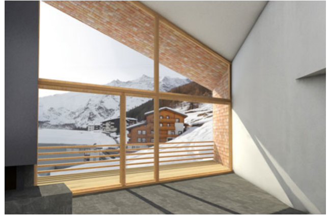
Aussicht nach Westen