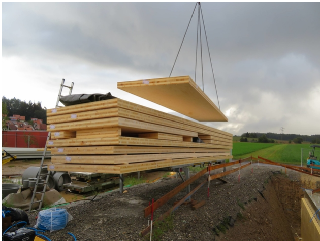
Anlieferung der CLT-Platten auf der Baustelle