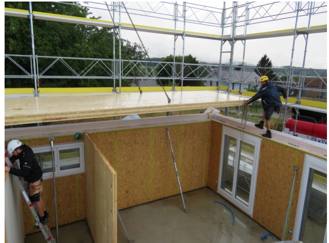
Montage der CLT-Platten auf der Baustelle