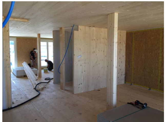
Stützen und Platten im Rohbau