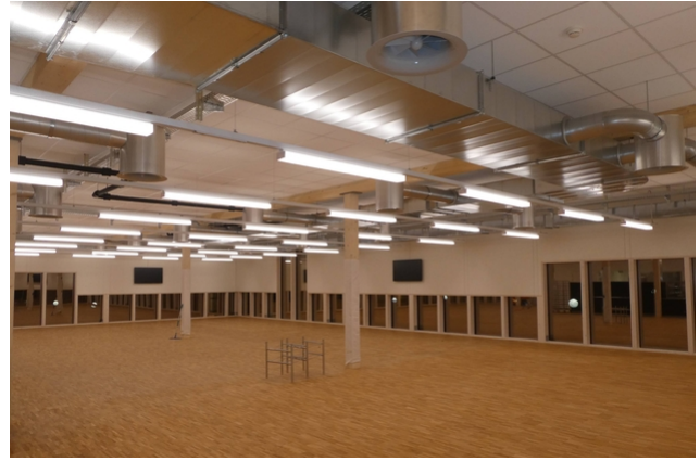
Innenraum vor Einrichtung