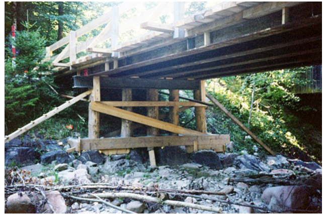
Notbrücke mit Stahlträgern