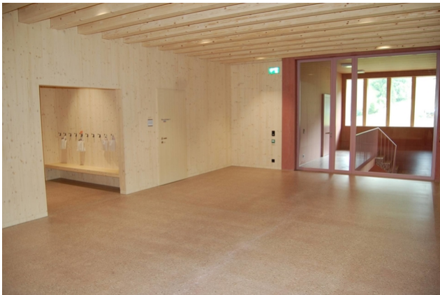
Treppenhaus mit Garderobe