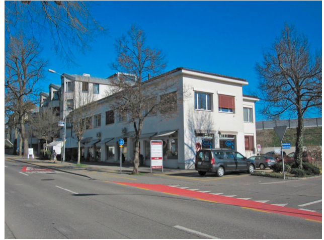
Das Geschäftshaus vor der Erweiterung