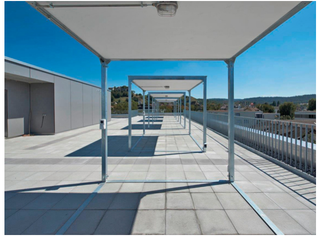
Großzügige Dachterrasse mit Blick auf Lenzburg